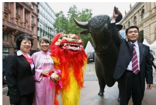
Die Börseneinführung der ZhongDe Waste Technology AG auf der Frankfurter Wertpapierbörse am 6. Juli 2007